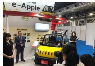
2019年東京モーター ショーでも大きな話題に

e-Appleを試乗した方が、よく言われるフレーズがあります。それは、 「乗ったときにワクワク感がある」というもの。単に移動の手段 である車を提供していません。私たちは、e-Appleを 通じてお客様にワクワク感を提供しているのです。